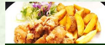
日替わりフライ盛り 900円

★ビアホールは5名様よりご予約承っております! お料理8品飲み放題付 120分 3,000円 〜