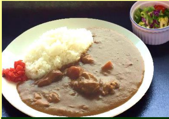
カレーライス ※サラダ付き